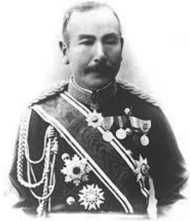
1897年ごろの肖像