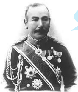
永山武四郎 1897年ごろの肖像