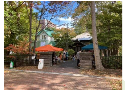
▲R3年門前にて開催 永山マルシェの様子