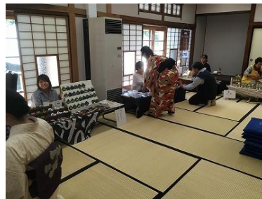
▲R1年和室にて開催 物販ブースの様子