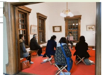
▲R3年洋間にて開催 音のインスタレーションの様子